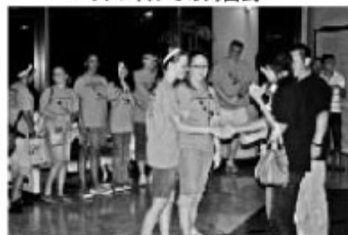
どうぞよろしく ～スマイルでの対面式～

滞在2日目は市役所象潟庁舎を、アナコーテス市からの訪問団と一緒に表敬訪問。その後、消防署を見学しました。消防士に憧れる子どもが多いとのこと、にかほ市消防職員の説明を、尊敬のまなざしで聞いていました。