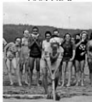
right! left! OK? ～平沢海水浴場～