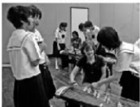
ハリウッド女優みたいにお付きの人が ～琴の体験：仁賀保中学校～

5日目、仁賀保中学校を訪問しました。夏休み中にも関わらず、全校生徒による大歓迎を受けました。その後、2年生の εργασコーナートにより、日本文化体験コーナーで交流しました。