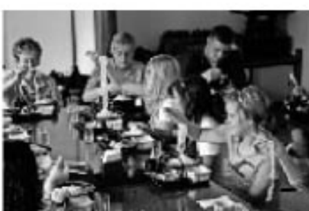
フォークでも四苦八苦 ～旧佐々木家住宅「曲屋」～

8月5日は早朝5時に「スマイル」に集合。別れを惜しむ涙が自然とこぼれました。ホストファミリーたちも秋田駅まで同行して、新幹線ホームで友人たちを見送りました。何度も抱きしめあい、握手し、手を振りながら、再会を約束していました。