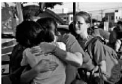
See You! See You Again! ～スマイル前～