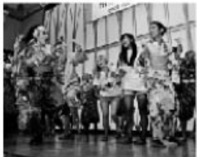
ヨサコイではしゃぐ ～歓迎パーティー～

4日目は午後から秋田市へ移動。竿燈まつりを見学しました。目の前で披露される妙技に驚き、小さな子どもたちの頑張りに「ジョヤサー！ジョヤサー！」の掛け声と拍手を送りました。