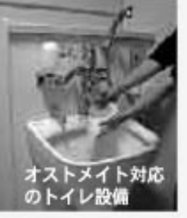
オストメイト対応のトイレ設備

総合福祉交流センター「スマイル」、金浦・象潟各保健センターの障害者用トイレに、オストメイト対応のトイレ設備機器が設置されました。この機器には、ストーマ装具の洗浄や汚れ物を洗える「汚物流し」設備や、汚れた腹部を洗えるお湯の出る「シャワー付水栓金具」等が設けられています。