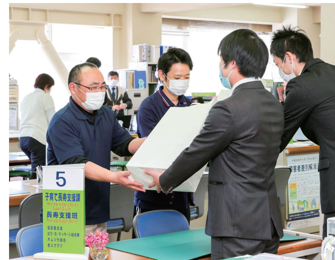
▲マスクを受け取りに来た福祉施設の職員

3月27日から29日にかけて、友好都市協定を結んでいる諸暨市からマスク10,000枚が届きました。これは、2月に市が諸暨市にマスク5,000枚を送ったところ、その返礼として頂いたもので、このうち2,000枚は新型コロナウイルス感染症拡大防止に役立てようと市内の福祉施設に配布されました。今後、残りのマスクも大切に使われていきます。