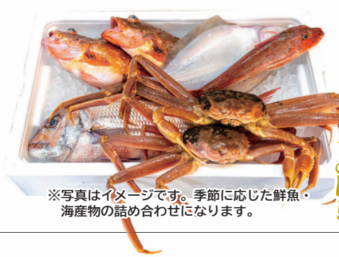
※写真はイメージです。季節に応じた鮮魚・海産物の詰め合わせになります。

長年、仲買人として自分の目で確かめてきた秋田さん。徹底的な地魚へのこだわりで、近所のお客さんより秋田や横手、さらに山形から買い求めるファンの方が多いほどです。今回、秋田商店さんから「旬の海鮮詰め合わせ」を3名様にプレゼント。たくさんのご応募お待ちしております。焼き魚や刺身なども準備できますので、ご用命の際はお気軽にご来店ください。