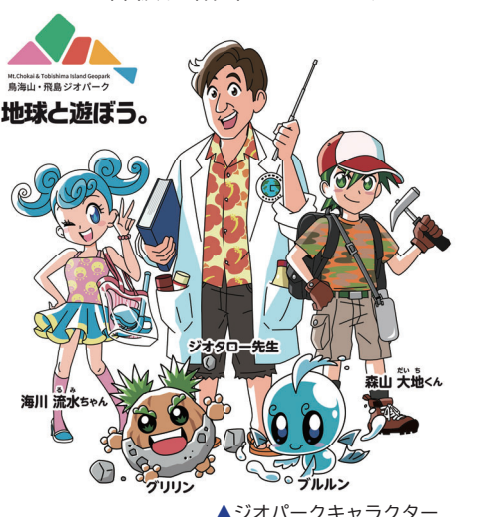
▲ジオパークキャラクター

ジオパークキャラクターは、にかほっぺんの作者でおなじみのイラストレーターの板垣奈々さんと協力して制作しました。新しいジオパークキャラクターはパンフレットや看板、循環バスなど、いろんなところに登場します。新しいジオパークキャラクターと一緒に、鳥海山・飛島ジオパークの不思議を楽しんでください。さあ、地球と遊ぼう!