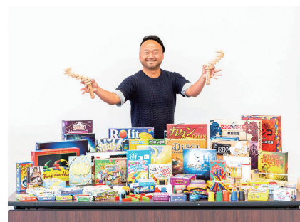
皆さん、ボードゲームを楽しみましょう!

の魅力をもっと多くの人に伝えていきたいと思っております。まちで見かけたら気軽に声をかけてください。