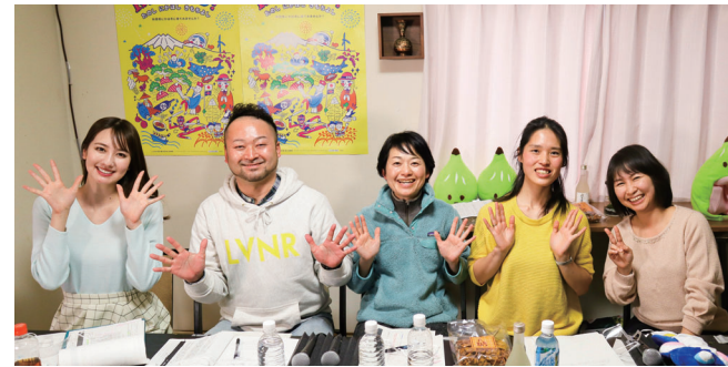
2月14日に行われた秋田移住オンラインツアー(にかほ市編)の様子

の亀崎さんと一緒に開催しています。仕事やお金の話だけでなく、にかほに暮らす人にも注目した内容になっています。にかほにはこんな人がいる、こんな楽しみ方ができる、を伝えたいからです。次回は5月8日(土)開催です。情報はHP「にかほ一む」に随時載せていきますので、ぜひご覧ください。