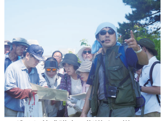
▲ガイド養成講座で指導の様子

数の豪雪地帯です。特に鳥海山の上の雪にはものすごいものがあります。雪が多いということはたいへんなことなのですが、同時に豊かな水資源を私たちに与えてくれます。それがこの土地の産業や暮らしを形作っています。このような風土を作ったのは実は大地の力です。雪がこの地域に多いのは1500万年前に日本海ができたためです。これほど雪が降るのはマグマが噴き出してできた鳥海山や地震のたびに隆起してきた出羽山地があるためです。鳥海山・飛島ジオパークの子どもたちには、ぜひふるさとを作った「地球の秘密」について学んで欲しいと思います。