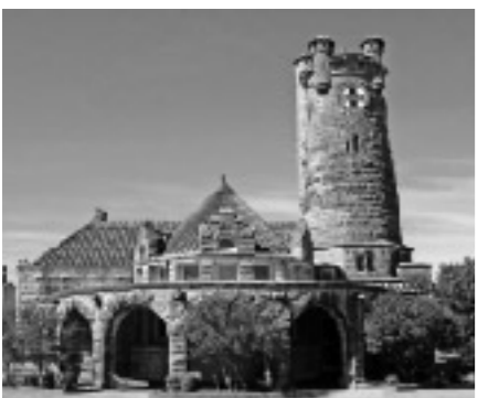
シヨウニーの名所サンタフェデポ

(一般家庭への滞在)、ニューヨークではホテルでの宿泊になります。 ・日程、個人負担等は変更される場合があります。 ・説明会を開催します。