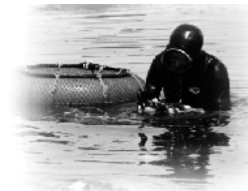
漁業者の岩ガキ漁

【注意】 海は漁業者が生計を得る漁業 生産の場として、また市民の遊 び・憩いの場として広く利用さ れています。 アワビ・カキ・サザエ等の貝 類、モズク・エゲシ等の海藻類は、 漁業者が稚貝を放流したり、生 産調整をしながら大切に育て、 生産しているものです。 これらの水産動植物は漁業権 の対象で、一般の方が採捕する と密漁として、漁業法により 罰せられることがあります。 (違反者は20万円以下の罰金) 環境保全や水産動植物の保護、 漁業との協調に理解を深め、海 の決まりを守った健全なレジャ ーを楽しみましょう。 秋田県漁協南部総括支所 ☎38・2210