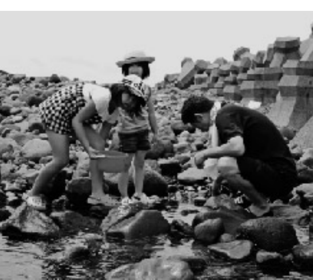
石の陰に何が隠れているかな？