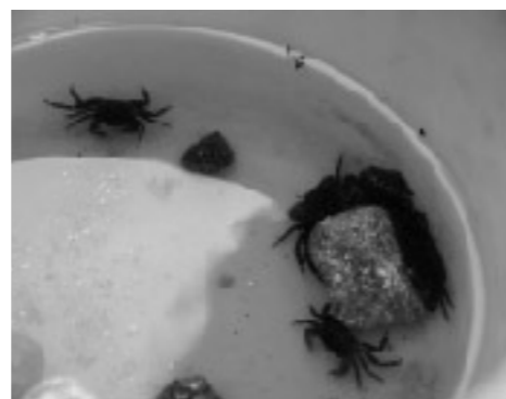
何種類の生き物がいるかな？