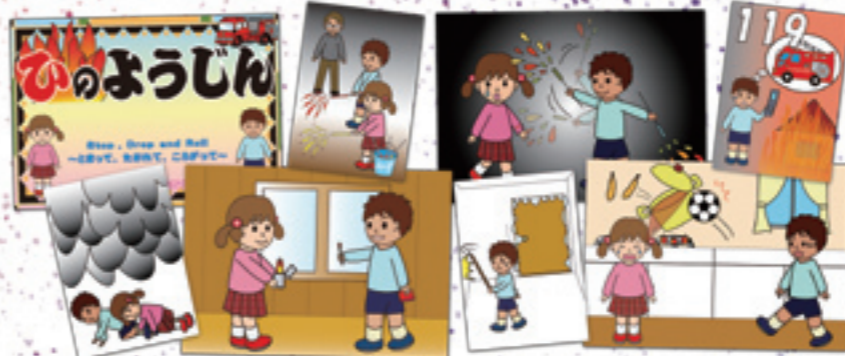
▲幼児向け防災教室用紙芝居「イラスト」全19枚 (にかほ市消防本部、にかほ市女性消防団)