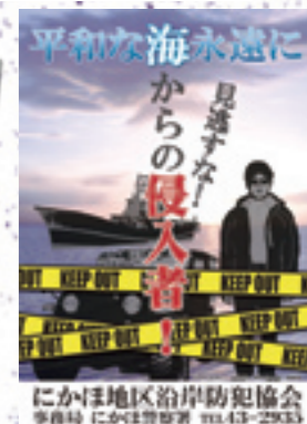
▲広報・啓発「ポスター」(にかほ地区沿岸防犯協会)