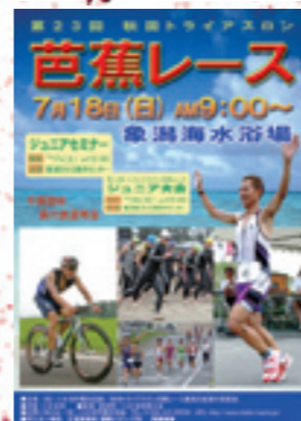
▲トライアスロン芭蕉レース「ポスター」(にかほ市観光協会)

情報メディア科では、今年もさまざまな活動に取り組んできました。地域貢献活動（公的機関などからの依頼による作品制作）としては例年、10件前後でしたが、今年度は19件と大幅に増加。ポスターや動画のほか、WEBやチラシなど、さまざまな媒体に挑戦できました。