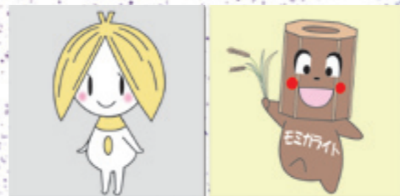
◀(左) モミガパワー (右) モミガライト 「イメージキャラクターデザイン」(NPO法人モミガラパワー)