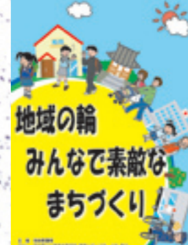
▲防犯啓発「ポスター」(にかほ警察署、秋田県警)