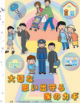
▲防犯啓発「リーフレット」(にかほ市防犯協会)