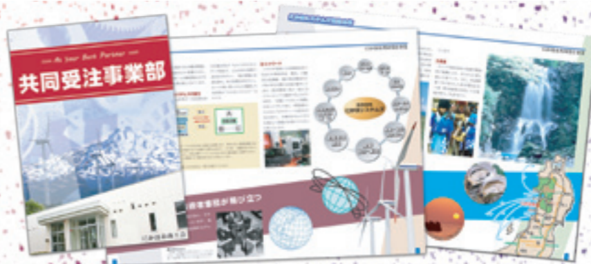
▲にかほ市共同受注事業部「パンフレット」A 4縦全8ページ (にかほ市商工会)