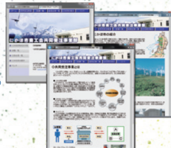
▲共同受注事業部「WEBサイト」(にかほ市商工会)

企画・編集／にかほ市広報委員会 発行／にかほ市役所 〒018-0192 秋田県にかほ市象潟町字浜ノ田1番地 ☎0184-43-3200 (代表) ☎0184-43-7510 (直通) ホームページアドレス http://www.city.nikaho.akita.jp 電子メールアドレス info@city.nikaho.lg.jp