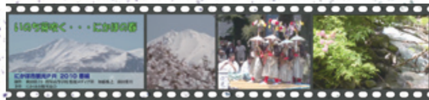
▲にかほ市観光PR 2010春編「動画」 YOUTUBEで発信中 (にかほ市観光協会)