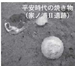
平安時代の焼き物 (家ノ浦II遺跡)

★遺跡見学会の予定や発掘調査速報は埋蔵文化財センターのホームページに随時掲載しています。 http://www.pref.akita.jp/gakusyu/maibun_hp/index2.htm