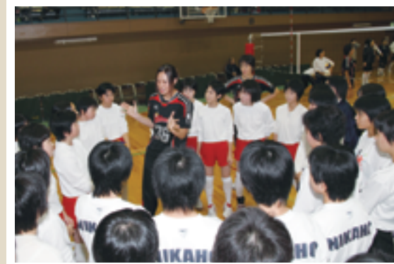
10/9 宝くじ普及広報事業でバレーボール元日本代表が来市。昔テレビで見ていた有名選手のプレー姿に、胸が高鳴りました… ㉔