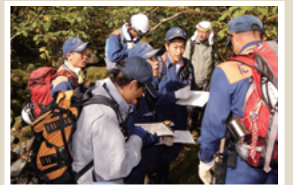
10/12 山菜採り入山者が遭難したことを設定した市の遭難訓練。6時間にも及んだ訓練内容に、若い？私の体力と集中力も限界でした。㉖

企画・編集／にかほ市広報委員会 発行／にかほ市役所 〒018-0192 秋田県にかほ市象潟町字浜ノ田1番地