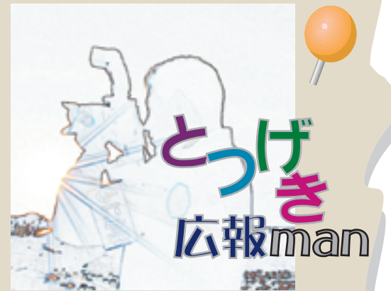
新コーナー『とつげき広報man』では、広報担当が取材した写真と率直な感想をお伝えしていきます！