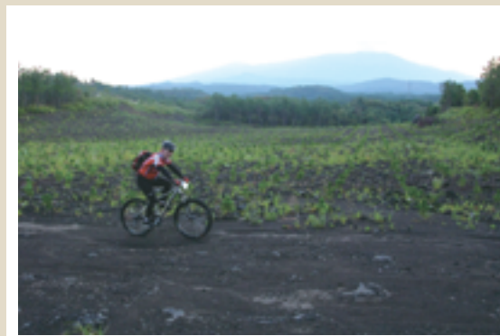
10/9 夜明け前にスタートした鳥海山グルッと一周MTBサイクリング。「鳥海山に上る朝日を背景に疾走するMTB」を意識してパシャ！ イメージどおりですか？ ㉕