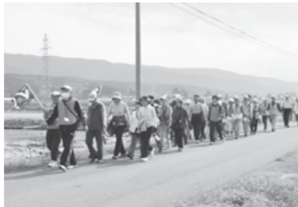
風景を楽しみながら軽快にウォーキング

とんがり童夢パオ、薫風苑を経由する12kmコースは9時50分にスタート。鳥海山は雲に隠れて見る事ができませんでしたが、かかしが見守る秋の田園風景を楽しみながら約3時間かけてゴール。参加者からは「天気がよくて良かった。風が吹いて楽だった」「楽しかった」などの感想が聞かれました。