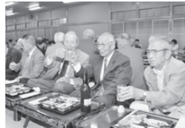
お互いの健康に乾杯（金浦地域）

「東洋の魔女」等の異名がついた往年の名選手や五輪メダリストらのバレー教室では「基本がなっていない」と叱咤される場面も。交流試合では地元チームがセットポイントを取る勢いを見せながらも、ドリームチームの選手たちが勝負にこだわる姿勢を見せ、貫禄を示しました。