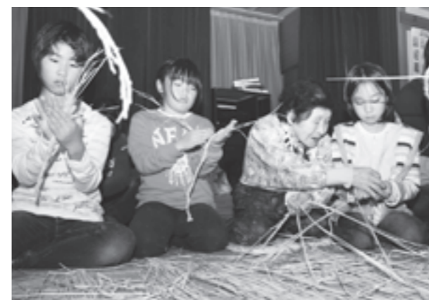
子どもたちも縄ないに挑戦

参加者たちは雨天の中、午前には稲を刈り、午後から会館で、わら細工のベテランたちから指導を受け、稲わらを使った縄ないから草履づくりに挑戦しました。「気持ちを集ませないと、出来上がりにムラがでる。心が縄に表れるね」などと感想が聞かれました。