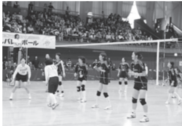
ドリームチームを本気にさせちゃった

宝くじの社会貢献広報事業として実施されている『はつらつママさんバレーボール』が10月9日、象潟体育館で行われました。元全日本代表のバレーボール選手など12名が、ママさんや中学生などと実技指導や試合で交流しました。見学・観客を含め約900名が参加。