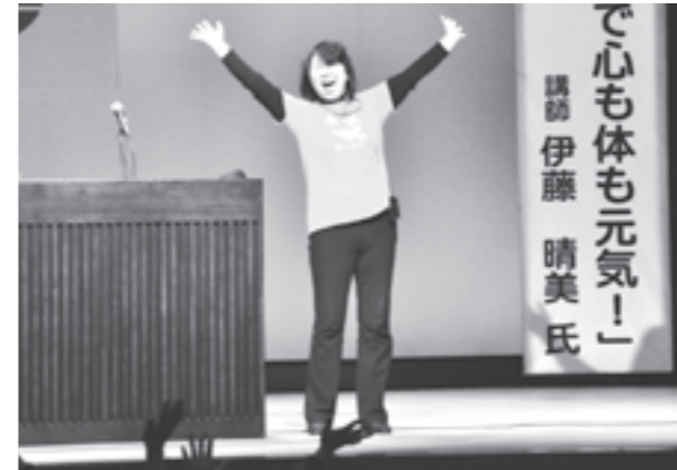
「笑い」で体ポカポカ、元気モリモリ

仁賀保勤労青少年ホームで2月12日、明るく住み良いまちづくりを目指すことを目的とした、にかほ市女性団体協議会主催の「女性のつどい」が行われ、約240人の市民が参加しました。