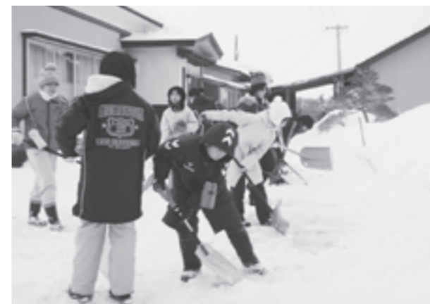
隅々までキレイに寄せました。

院内小学校では、昨年からの雪寄せボランティアを実施しており、今年で2年目となります。