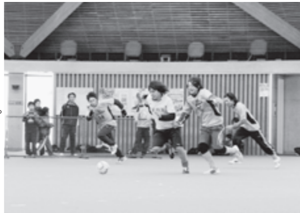
家族が見守る中、ハッスル！